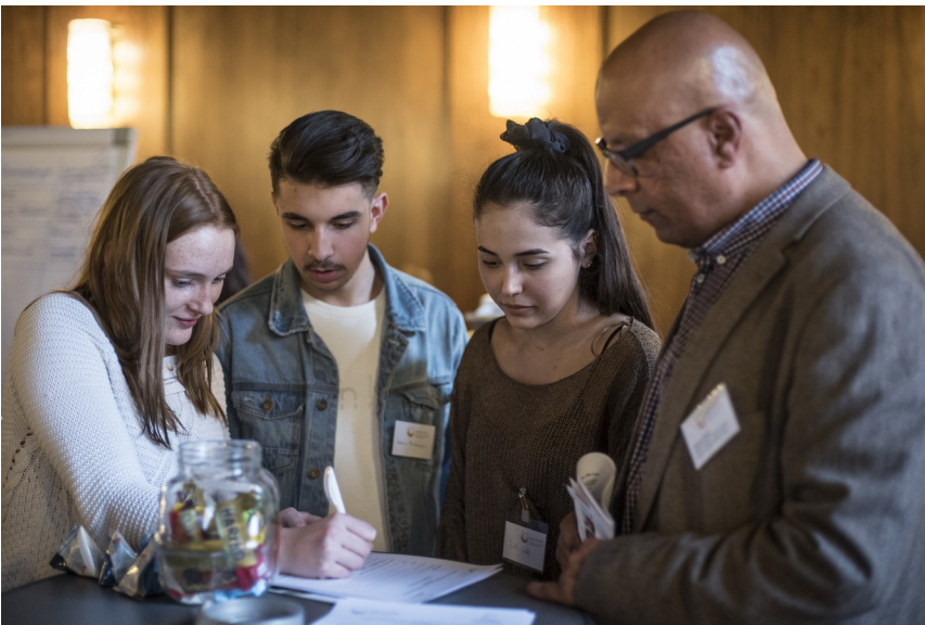
Eine schriftliche Vereinbarung entsteht

Am 23.März.2017 trafen Unternehmen und Einrichtungen im Schönen Saal im Nürnberger Rathaus ein, brachten ihre vorbereiteten Steckbriefe mit und stellten diese auf. Im Anschluss wurde die Veranstaltung und der Galery Walk, bei dem sich alle Organisationen über Angebot und Nachfrage informierten, eröffnet.