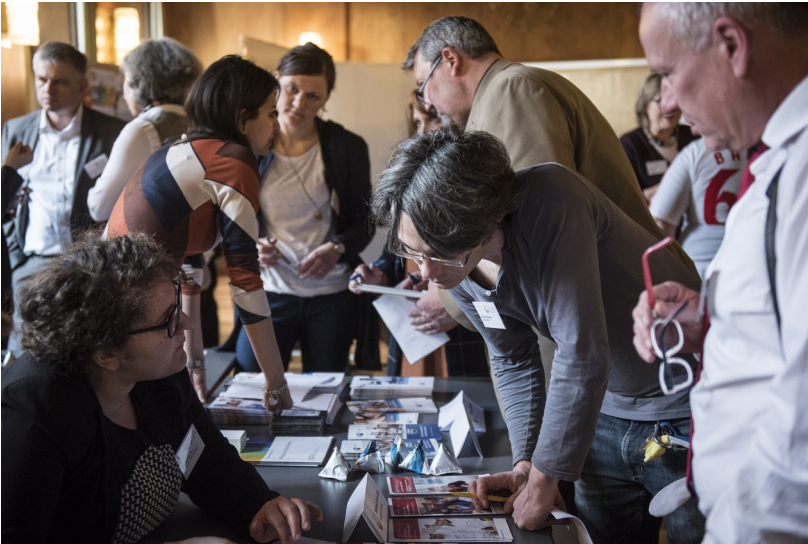
Intensive Gespräche am Tisch der Expertinnen und Experten

Für Fragen oder Anregungen zu den teilweise sehr komplexen Rahmenbedingungen des Asyl- und Arbeitsrechts in Deutschland sollten sich alle Organisationen an den Expertentisch wenden.