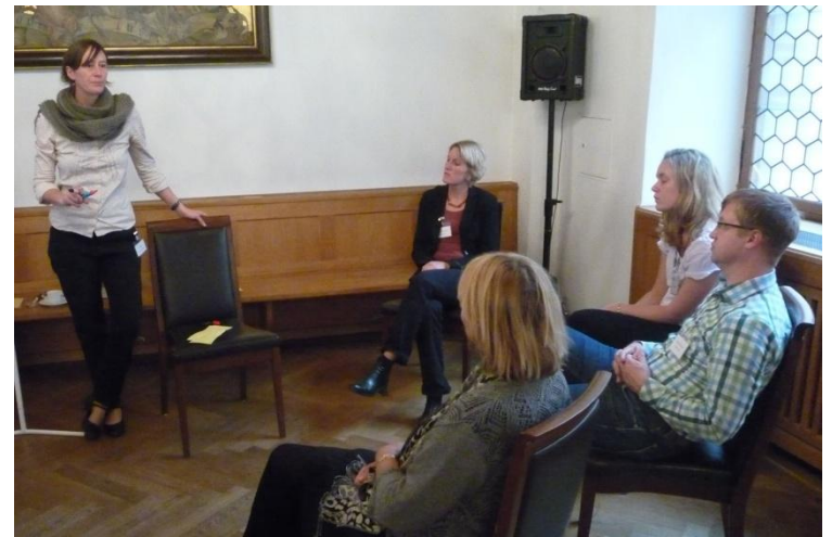
WS Einführung in die Marktplatz-Methode München 26.9.2012